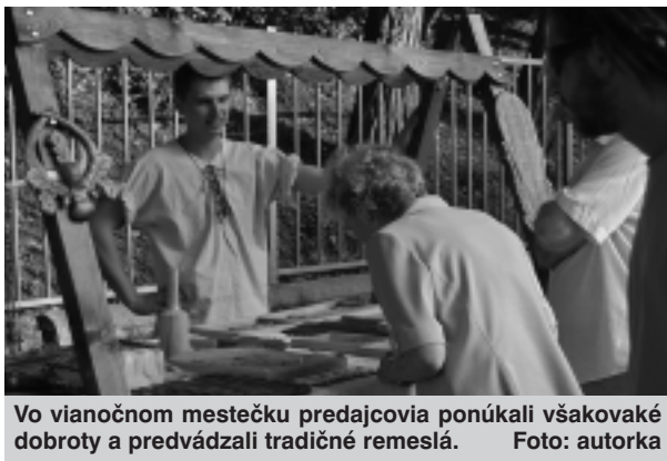
Vo vianočnom mestečku predajcovia ponúkali všakovaké dobroty a predvádzali tradičné remeslá.

Uvedomujeme si, že Nitra sa jarmočnou tradíciou nemôže prirovnávať k takým jarmokom ako sú Levický či Radvaňský jarmok v Banskej Bystrici. Nitrania však napriek tomu svoje jarmoky majú radi a radi ich aj navštevujú.